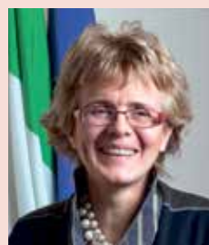
per la Fotografia, la scienziata e senatrice Elena Cattaneo