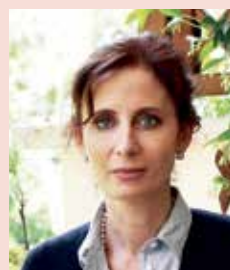
per la Letteratura la scrittrice Margaret Mazzantini

L'appuntamento con i vincitori della 38ª edizione del Premio Hemingway, sarà sabato 18 giugno alle ore 20 al Cinecity di Sabbiadoro. A condurre la serata sarà la nota giornalista Elsa Di Gati, volto di programmi storici della TV italiana "Mi manda Raitre". I personaggi che riceveranno l'ambito riconoscimento sono personalità di grandissimo spessore culturale e di grande prestigio per la nostra nazione, arricchendo così il patrimonio degli eventi di questa stagione turistica.